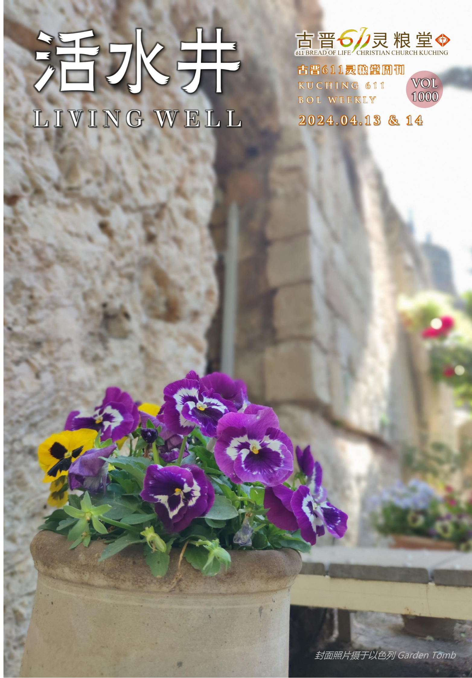
封面照片摄于以色列 Garden Tomb